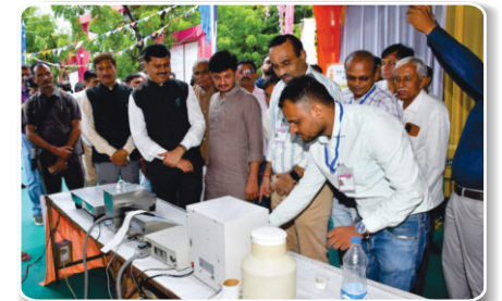
कंपनी के उत्पादों का गणमान्य व्यक्तियों एवं ग्रामीण समाज के समक्ष प्रदर्शन

तारनेतर मेले के दौरान कंपनी के उत्पाद को ग्रामीण समाज के सामने सफलतापूर्वक प्रदर्शित किया गया।