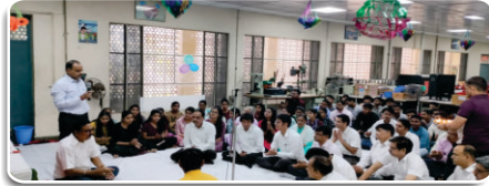
कंपनी परिसर में विश्वकर्मा पूजा का आयोजन