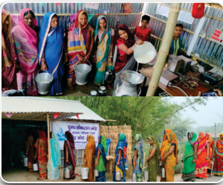
बिहार के बरसम में महिला दुग्ध सहकारी समिति में दूध संग्रह

इसके अलावा, मध्य, गुजरात, पूर्वी, दक्षिणी, उत्तरी और राजस्थान क्षेत्र से 124 इलेक्ट्रॉनिक मिल्क टेस्टर; मध्य, पूर्वी गुजरात, उत्तरी, राजस्थान और दक्षिणी क्षेत्र से 1163 मिल्क एनालाइजर; राजस्थान क्षेत्र से 03 एडवांस इलेक्ट्रॉनिक मिल्क अडल्ट्रेशन टेस्टर (ईमैट एडवांस) और पूर्वी क्षेत्र से 01 सोमैटिक सेल काउंटर के ऑर्डर प्राप्त हुए हैं। इस प्रकार रील अपने इन सिस्टम्स के माध्यम से निरंतर किसानों को सशक्त बनाती आयी है एवं डेयरी क्षेत्र में बदलाव लाने के लिए समर्पित हैं।