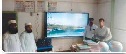
स्मार्ट क्लास रूम सिस्टम के उद्घाटन के चित्र