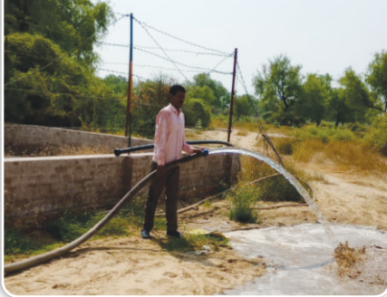
10 एचपी एसपीवी वॉटर पंपिंग सिस्टम